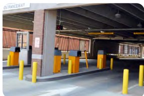
Control de Vehículos