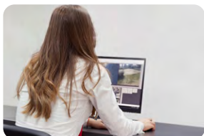
Monitoreo de Cámaras