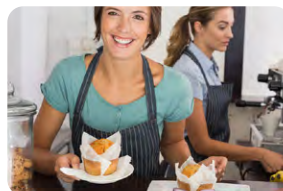
Módulo de Consumos